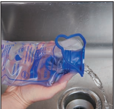
5) Vacíe la bolsa de alimentación y repita el último paso hasta que la bolsa sólo contenga agua limpia.