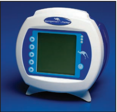
1) Desconecte el set de alimentación del paciente antes de purgar. El set de alimentación debe permanecer cargado durante el procedimiento de purga.