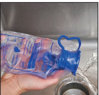
9) Vacíe el agua de la bomba. Cebear para eliminar toda el agua que quede en el set de alimentación.