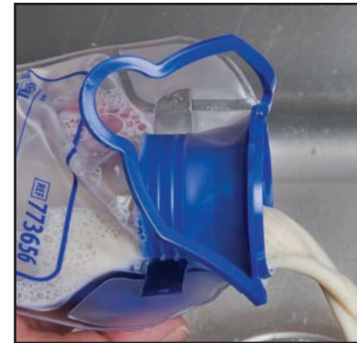
3) Vacíe el contenido de la bolsa de alimentación.