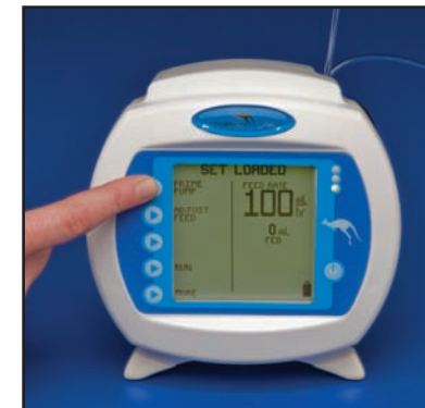
7) Oprima el botón "Prime Pump" (Cebear la bomba) para entrar a esta pantalla.