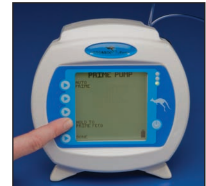
8) Mantenga presionado el botón "Hold to Prime" (Presione para cebear) hasta que fluya agua limpia solamente por el tubo. Una vez que el rotor comienza a funcionar, tarda entre 1 y 2 minutos.