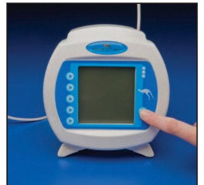
3) Para descargar correctamente el set de bomba, apáguela y espere 10 segundos antes de sacar el set de alimentación.