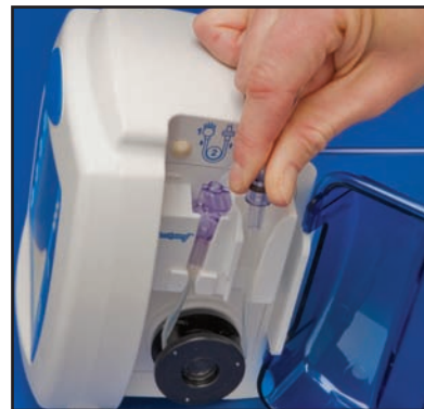
2) Tome el sujetador de anillo negro y suavemente pase el tubo alrededor del rotor e inserte el sujetador en la cavidad derecha. No ajuste en exceso los tubos.