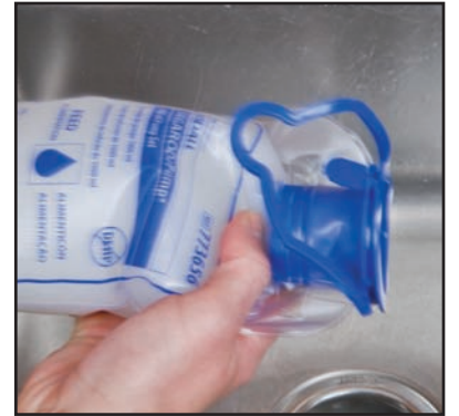
4) Llene la bolsa de alimentación con agua hasta aproximadamente la mitad de su capacidad total. Selle apropiadamente la bolsa y agítela durante 5 a 10 segundos.