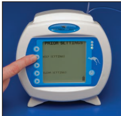
6) Encienda la bomba. Seleccione "Keep Settings" (Mantener parámetros) para continuar con los ajustes anteriores o "Clear Settings" (Eliminar parámetros) para empezar a programar los nuevos ajustes de la bomba.