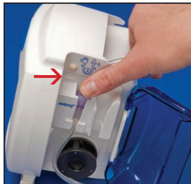
1) Tome la orejeta en la válvula e insértela con firmeza en la cavidad izquierda. Asegúrese de que la válvula esté bien ajustada. La orejeta debe alinearse con la línea blanca levantada a la izquierda.