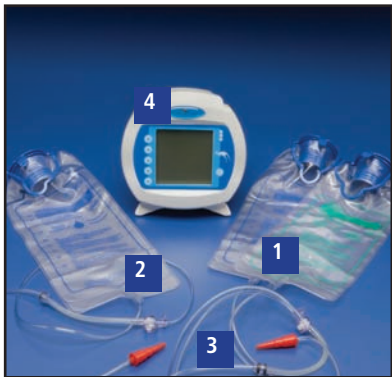
1) Montaje de válvula de alimentación e irrigación, 2) Montaje de válvula de alimentación solamente, 3) Extremo distal del set de alimentación, 4) Bomba