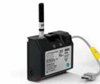
◆ GPRS / Wi-Fi Kit