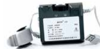
◆ SpO 2 Kit