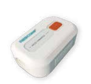
◆ Ventilator Disinfectant