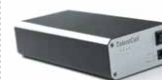
◆ Power Bank (D1402)