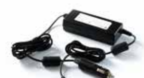
◆ DC/DC Converter