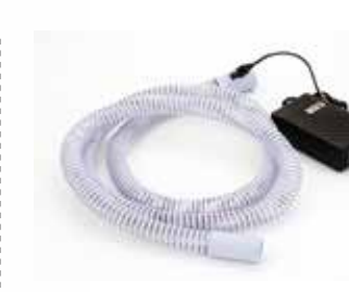
◆ Heated Tubing